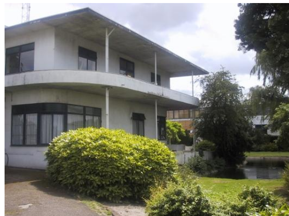
: Villa 2002