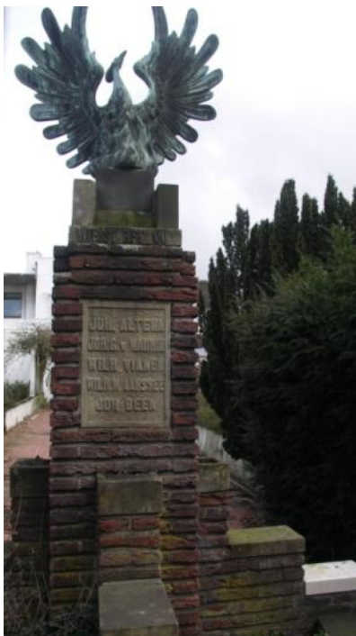
Oorlogsmonument