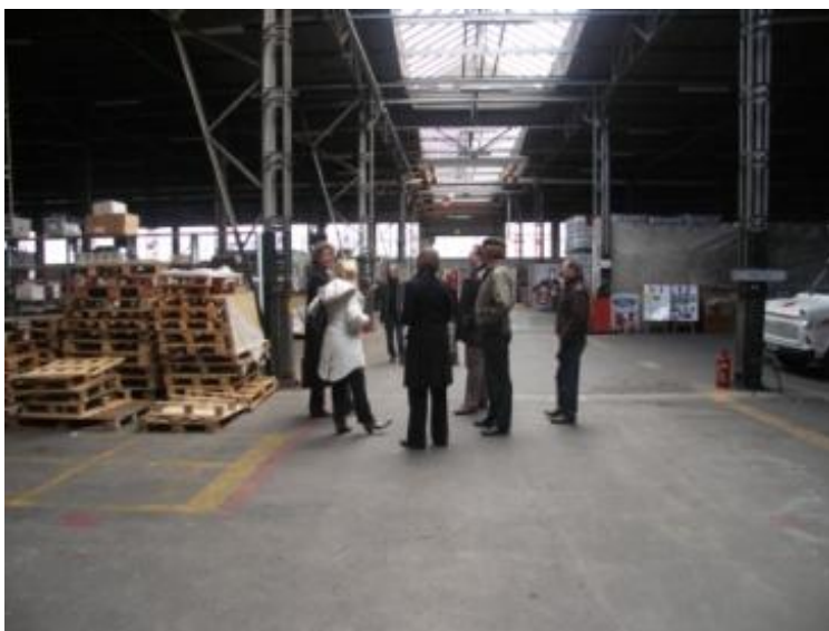
Rondleiding maart 2007

Na de oorlog keerde de familie terug in de villa. De weduwe van Jan Jongerius bewoonde een gedeelte van het huis, een ander gedeelte van het huis werd na 1947 bewoond door het snel groeiende gezin van Jan Jongerius junior. De schare kinderen die hier is geboren, gebruikte de brede leuning van de marmeren trap nu eens niet als statussymbool, maar als glijbaan. In 1955 verliet de familie Jongerius, nu definitief, de villa. Het hele complex kwam in handen van het ministerie van Defensie. In de loop der jaren werden verschillende mensen en onderdelen in de villa gehuisvest zoals bijvoorbeeld de tandheelkundige dienst. In 1999 werd het pand gekraakt en door de krakers omgedoopt tot 'Villa Staatsgeheim'. Dit intermezzo is van korte duur want het ministerie van Defensie kan aantonen dat er al plannen bestonden om villa en kantoor te verhuren aan een productiemaatschappij als locatie voor televisieseries. De eerste jaren van deze eeuw zijn er inderdaad een paar series opgenomen, waaronder Hartslag , maar ook deze gebruikers hebben de panden, deze keer niet bepaald in ongeschonden staat, weer verlaten. In de villa woont nu een anti-kraakbewoner.