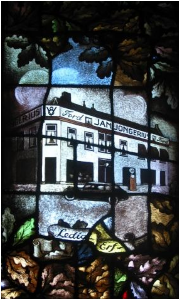
Paneel van het glas in loodraam in het kantoor. Voorstelling de garage aan het Ledig Erf in Utrecht.