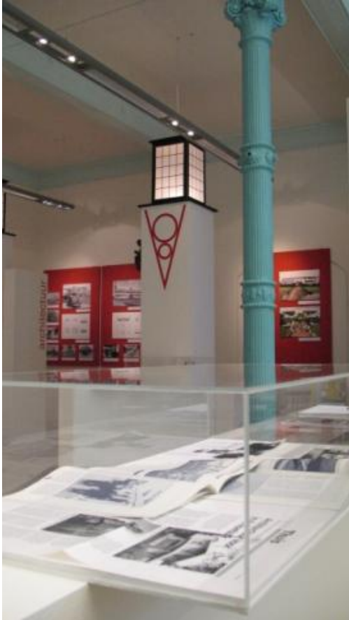
: tentoonstelling Aorta, foto Aorta.