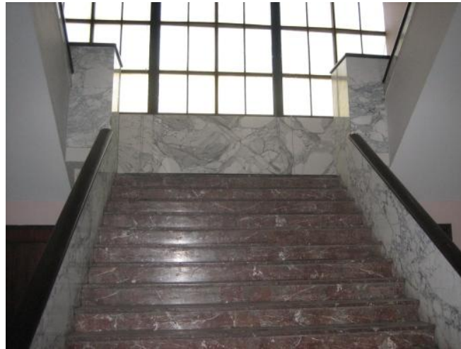
trap villa.JPG