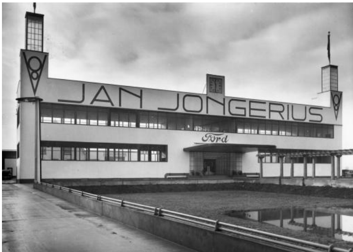
Gevel kantoor

Dat er in de fabriek niet altijd naar wens van de Duitsers werd gewerkt, onderdelen werden bijvoorbeeld met vier moeren vastgezet waar dat er twaalf zouden moeten zijn, had de buitenwacht niet waar kunnen nemen en ondergrondse activiteiten waren uiteraard helemaal niet zichtbaar geweest. Frans van Seumeren 7 , een van de 53 kleinkinderen van Jan Jongerius en bestuurslid van de Vrienden van het Jongeriuscomplex, vertelt in zijn toespraak op de 'feestelijke bijeenkomst' over de vrachtwagens van Jongerius die kinderen naar het Noorden van het land vervoeren. Maar liefst 122 keer werden wapens en munitie voor de illegaliteit vervoerd. Het 123ste transport vloog in de lucht, waarbij drie personeelsleden omkwamen. Een monument op het terrein herinnert nu nog aan die gebeurtenis en aan het bombardement in november 1944 waarbij nog eens twee personeelsleden omkwamen. De verzetsgroep 'de Kappégroep' die opereerde van onder de montagehal waarin onder andere V1 motoren werden gereviseerd, verliest in de oorlog acht van de dertien leden. Ir. Jaap Franso woonde tijdens de Tweede Wereldoorlog tegenover het complex: "Elk Engels bombardement vonden wij even spannend", herinnert hij zich. Job van der Horst kwam in de hongerwinter als schipperskind op het complex in een houten huisje terecht omdat het schip van zijn ouders werd gevorderd door de bezetter. Als vijfjarige pleegt hij dan al 'verzetsdaden' als hij samen met zijn neefje zand in brandstoftanks gooit.