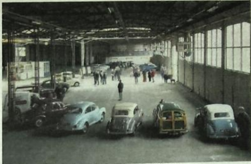
Nog een keer verzamelen in de Morrishal