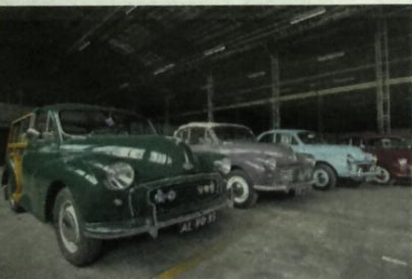
Diverse modellen van Morris op een rij

Eén van de fabriekshallen die gesloopt gaat worden, wordt nu nog steeds de Morrishal genoemd. Een bijzondere naam voor een hal op het terrein van een Forddealer...!