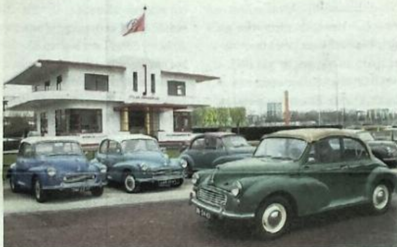
Defilé langs het oude Jongeriusgebouw