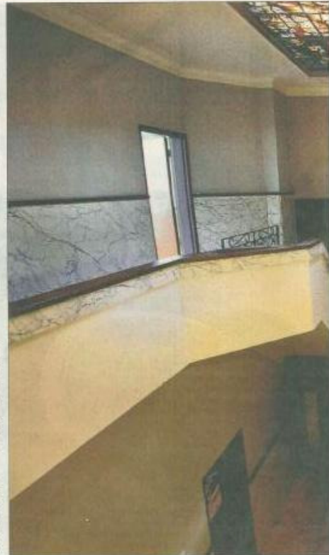
ren in de woonkamer van Jongerius-villa. Dat is een unicum. E en w vergaderden nooit buiten het stadhuis.

Om het belang van het behoud kracht bij te zetten, vergaderden burgemeester en wethouders giste-