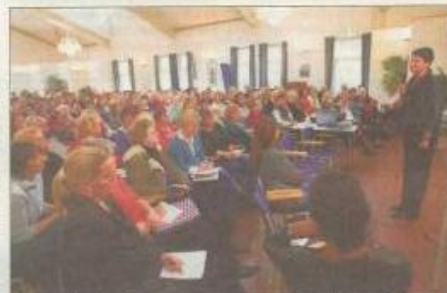
Ruim 250 vrouwen horen dat zij hun baan als huishoudelijke hulp verliezen. Andere werkgevers bieden een lager loon.